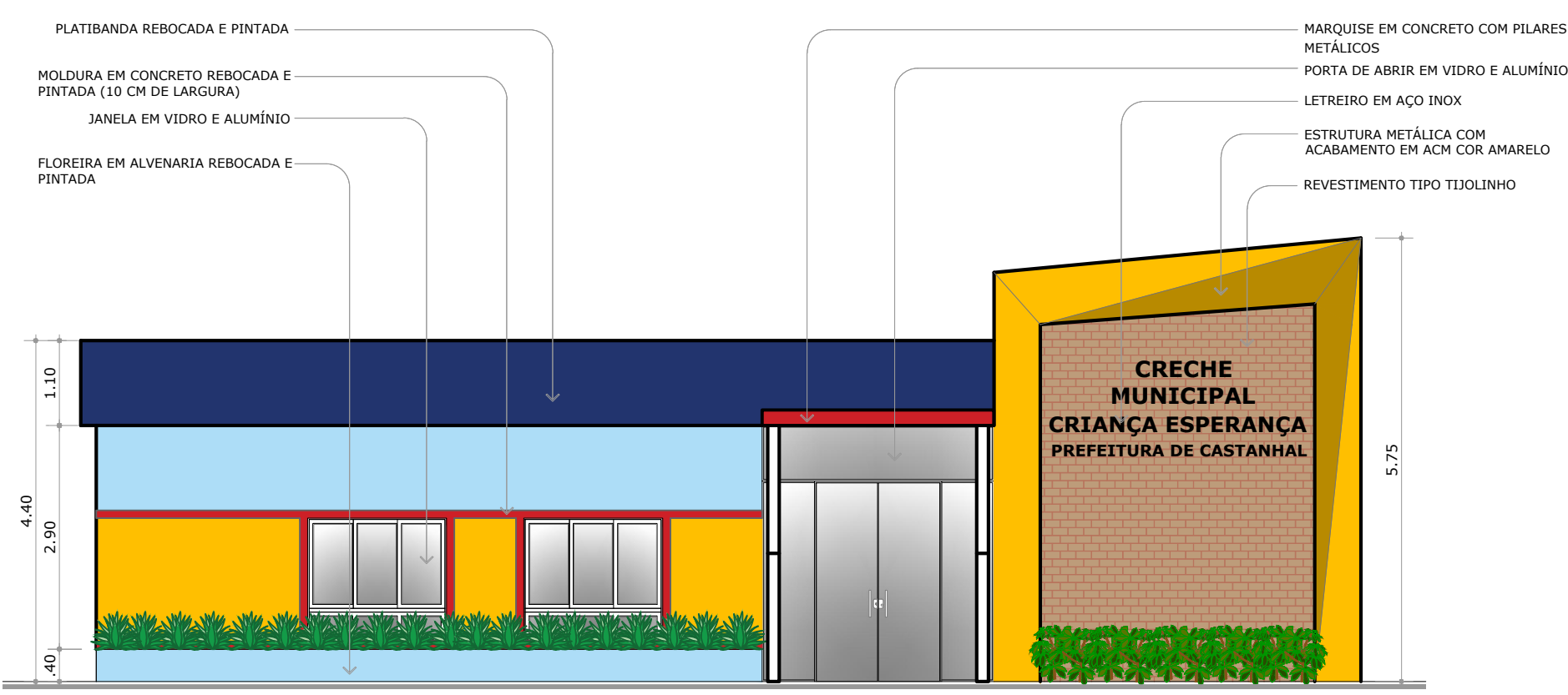
ELEVAÇÃO 02 (SEM MURO) ESC.: 1/75